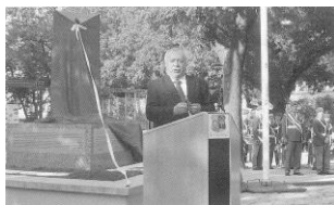
除幕式典で挨拶する ミヒヤエル・ホイペール ウィーン市長