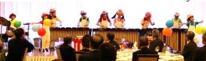
「情熱大陸」や「UFO」も演奏

そして、事務局に代わり司会より、これまでの協会活動への感謝と会員の皆様のご多幸を祈念する挨拶があり、ファイナルパーティはおひらきとなりました。