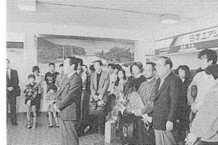
広島空港での壮行式