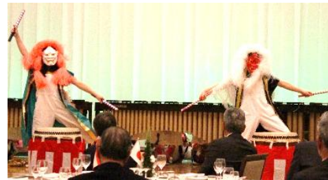
お面を被った連獅子のパワフルなパフォーマンス