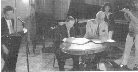
友好提携の調印を行う橋本会長とカドレチェック喫日協会会長(ウィーン・エロイカホール)