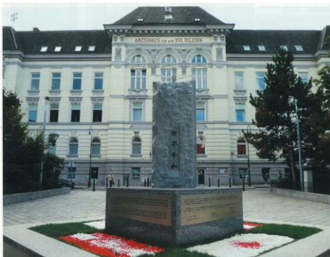
広島の被爆石で建立した平和モニュメント ～ウィーン第16区役所前～

除幕式典にはウィーン市長や田中駐オーストリア日本国大使を始め、市民約400人が参加した。