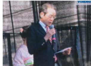
(2013年9月) 大社会長も参加し挨拶