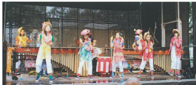
(2015年9月) 広島ジュニアマリンバアンサンブルがパフォーマンスを披露