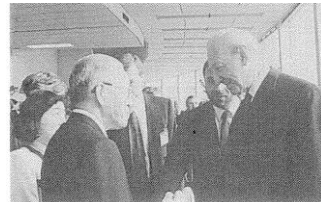
国連デー・レセプションでワルトハイム・オーストリア大統領と歓談する篠原会長