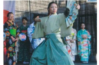
特設ステージで詩吟にのせて舞をする「詩舞」を披露