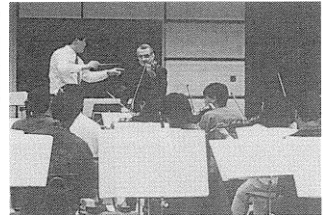
ウィーンフィルの首席コンサートマスター ゲルハルト・ヘツェル氏との音あわせ