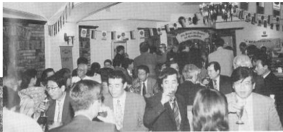
第3回ビア・ホールの会(1996年)(アサヒビアケラー広島)