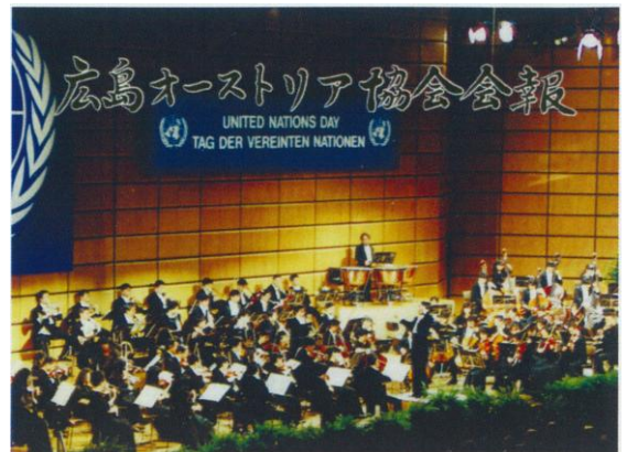
◀協会会報第7号表紙より▶

10月24日(第46回国連創立記念日)にオーストリアセンターで演奏する広島交響楽団《演奏曲》 糀場富美子作曲『戦争レクイエム』 モーツァルト作曲『ヴァイオリン協奏曲第5番「トルコ風」』 ドヴォルザーク作曲『交響曲第9番「新世界より」』他オーストリア、ヨーロッパで中継放送された(日本ではNHKが衛星録画放送)