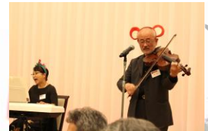
カチューシャを着けての演奏に、会場から手拍子も

恒例のプレゼント抽選会では今回もたくさんの豪華賞品がテーブルに並び大いに盛り上がりました。ご提供いただきました会員の皆様には心より御礼申し上げます。