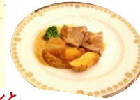
オーストリアワインと、オーストリア料理の「ローストポーク シュヴァイネブラーテン」