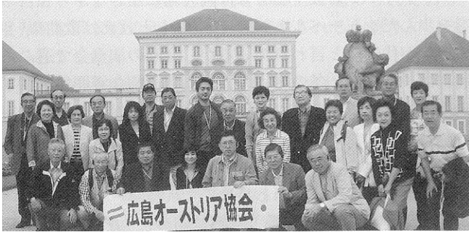
参加者全員での記念撮影