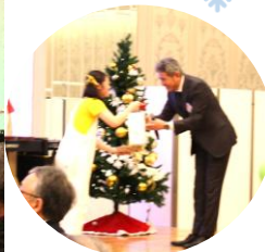
三吉会長からクリスマスプレゼント♪