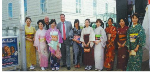
(2010年9月) ウィーン第16区のプロコップ区長と「着物ショー」のモデルを務めたウィーン在住日本人の皆さん

「平和モニュメント設置」を記念して、ウィーン第16区役所が中心となって毎年9月に開かれるようになった「ジャパNDER」には協会員も参加。日本文化の紹介や音楽演奏と共に親善交流を行った。