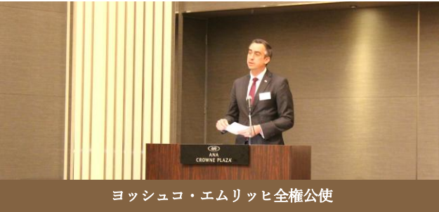
ヨッシュコ・エムリッヒ全権公使

挨拶の後は「Prost!」と高らかに乾杯のご発声をいただき、和やかにスタートした懇親会。定番となったウィーンのビール「Gösser」(ゲッサー)やオーストリアワインと共に、オーストリアにちなんだ料理をお楽しみいただきました。